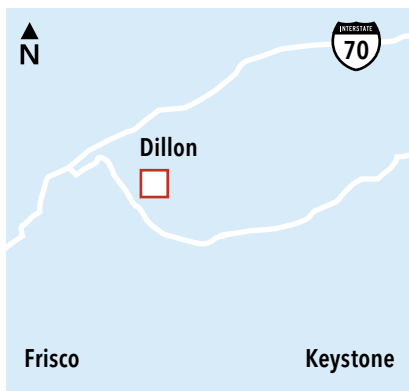
Los mapas no están a escala